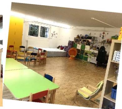
Raum Zopf matt